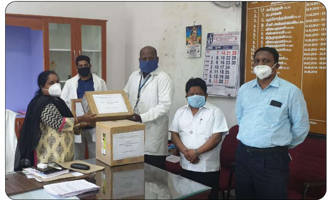
Sri Sai Ram Homoeopathy Medical College & Research Centre gave 13000 Preventive Medicines (Immune Boosters) to Greater Chennai Corp Zone., XI - Valasaravakkam