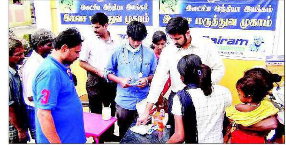
సాయిరాం విద్యాసంస్థల ఆధ్వర్యంలో నిర్వహిస్తున్న ఉచిత వైద్యశిబరం

ప్రారంభం: సాయిరాం విద్యాసంస్థల ఆధ్వర్యంలో వరద ప్రభావిత ప్రాంతాల్లో గత వారం లోజులుగా సహాయాల పంపిణీ కార్యక్రమం, ఉచిత వైద్యశిబరాలు నిర్వహించారు. రాష్ట్రంలో భారీగా కురిసిన వర్షాలకు చెన్నై, కాంచీపురం, తిరువళ్ళూరు జిల్లాలు తీవ్రంగా దెబ్బతిన్నాయి. వరదల్లో చిక్కుకున్న ప్రజలను ఆదుకొనేందుకు స్థానిక తాంబరంలో వున్న సాయిరాం విద్యా సంస్థలు ముందుకు వచ్చాయి. తాంబరం పరిసరాల్లో వున్న 20కి పైగా గ్రామాల్లో బాది తులకు దుప్పట్లు, టవళ్ళు, ధోవతులు, చీరలు, ఆహారం పంపిణీ చేశారు. కనీవీని ఎరుగని రీతిలో చాలా ఏళ్ల అనంతరం కురిసిన వర్షాల