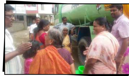
Daily 40,000 litres of purified drinking water distributed in flood affected areas